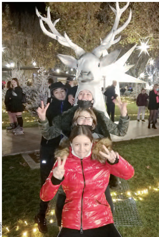
Des jeunes du SOAE de Béziers lors d'une sortie cet hiver.